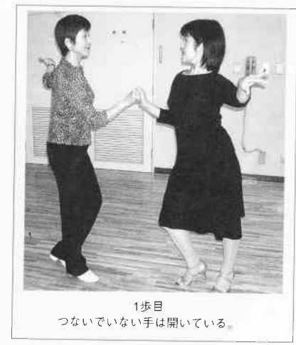
1歩目 つないでいない手は開いている。

パターン 4 チェンジ・オヴ・プレイス (左から右) の最後 (QQ) 《この形をオープン・ブレイクと言います》で【右】になります。ここから男性は左足後退しながら女性にジルバ・ウォークをリードします (写真2枚)。ここでは女性を (SSSS) と4歩前進させましょう。