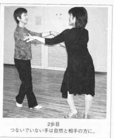
2歩目 つないでいない手は自然と相手の方に。