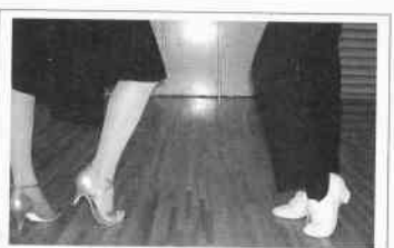
逆方向から見た形。軸足の使い方にも注目! 上が1歩目、下が2歩目。